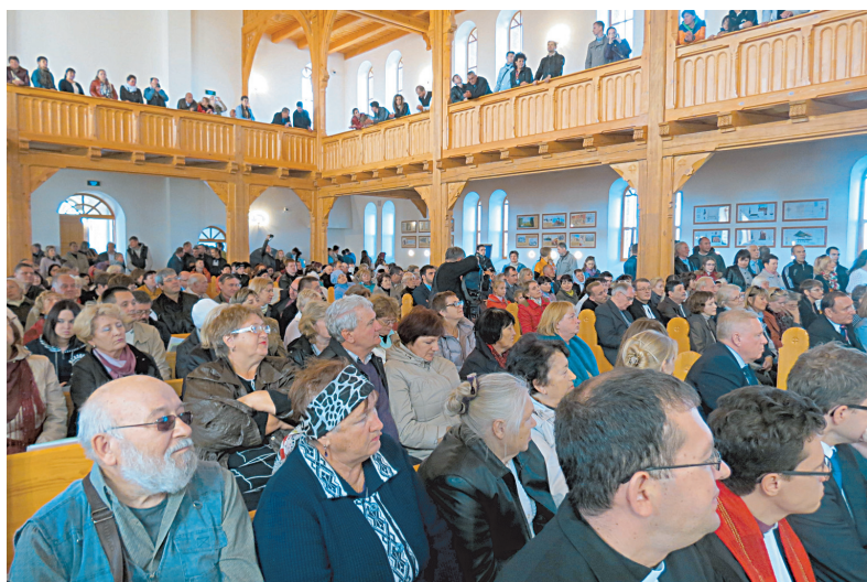
Сотни неравнодушных собрались на торжество