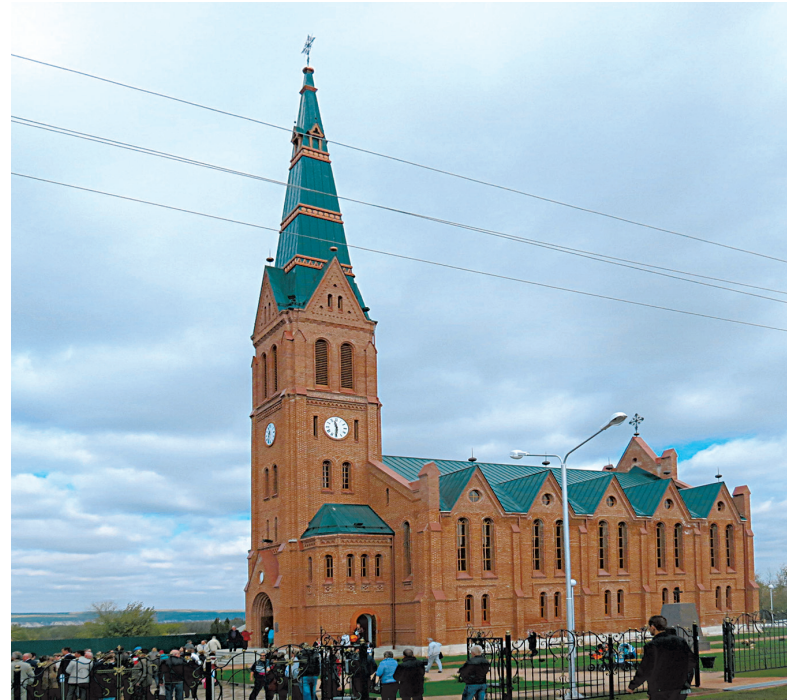
Изящный шпиль вновь взмыл в небо