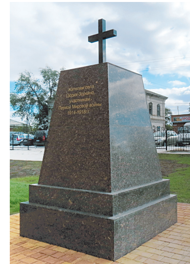
Памятник установили рядом с кирхой