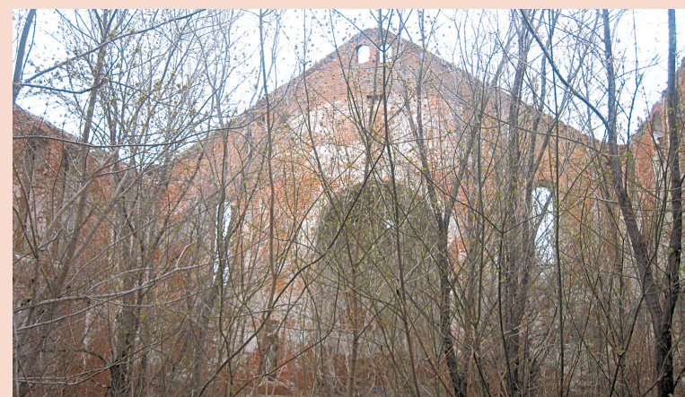
Так выглядела церковь внутри всего три года назад